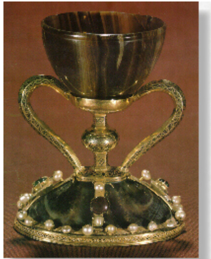
Il santo Caliz (Gral von Valencia)